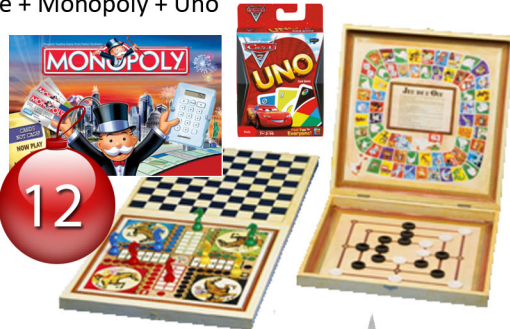
Lot de jeux de société Malette + Monopoly + Uno