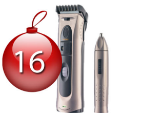
Tondeuse cheveux barbe + nez/oreille