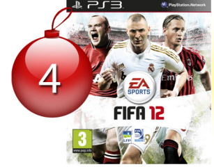
FIFA 12 - PS3