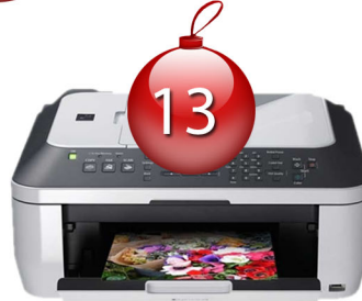
Imprimante et scanner