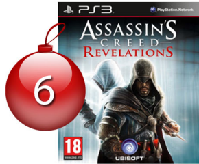
Assassin's Creed - PS3