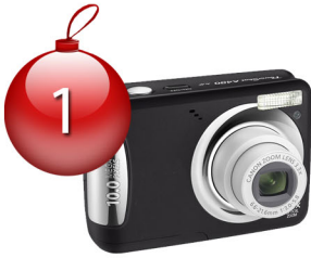
Appareil photo, 8MP + carte mémoire