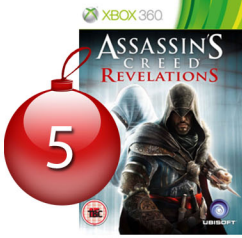
Assassin's Creed - XBOX