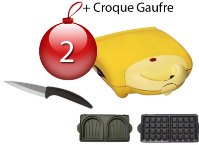
1 couteau en céramique + Croque Gaufre