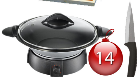
WOK + 1 couteau en céramique