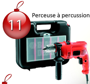
Perceuse à percussion