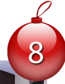
Une journée SPA illimitée