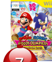
Mario Sonic aux JO 2012 - Wii